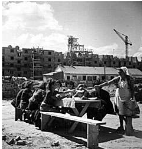
Ebéd Sztálinváros építése közben