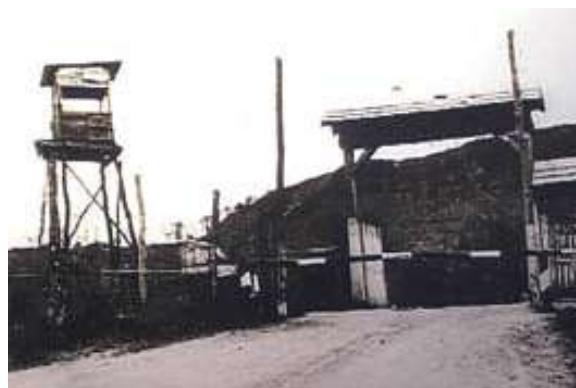
A recski munkatábor bejárata