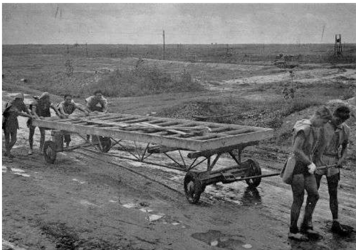
1950: valahol Dunapentelén