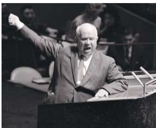
Nyikita Hruscsov, szovjet diktátor