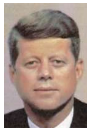
J. F. Kennedy, az USA elnöke