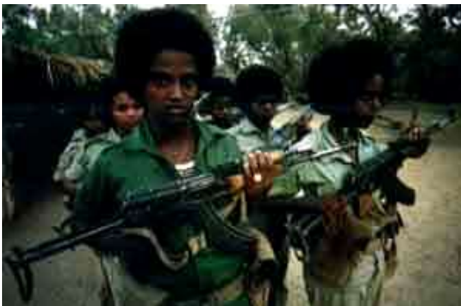
Afrikai gerillák (népfelkelők)