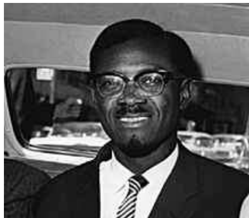
Lumumba, Kongó miniszterelnöke