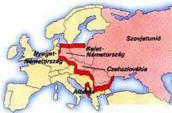
A vasfüggöny a valóságban és a térképen