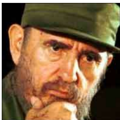
Fidel Castro, Kuba kommunista diktátora