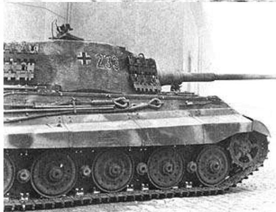
Budapesti látképek 1945-ből

1945. április elejére az ország egész területe szovjet katonai megszállás alá került, a háborút ismét a vesztesek oldalán fejeztük be.