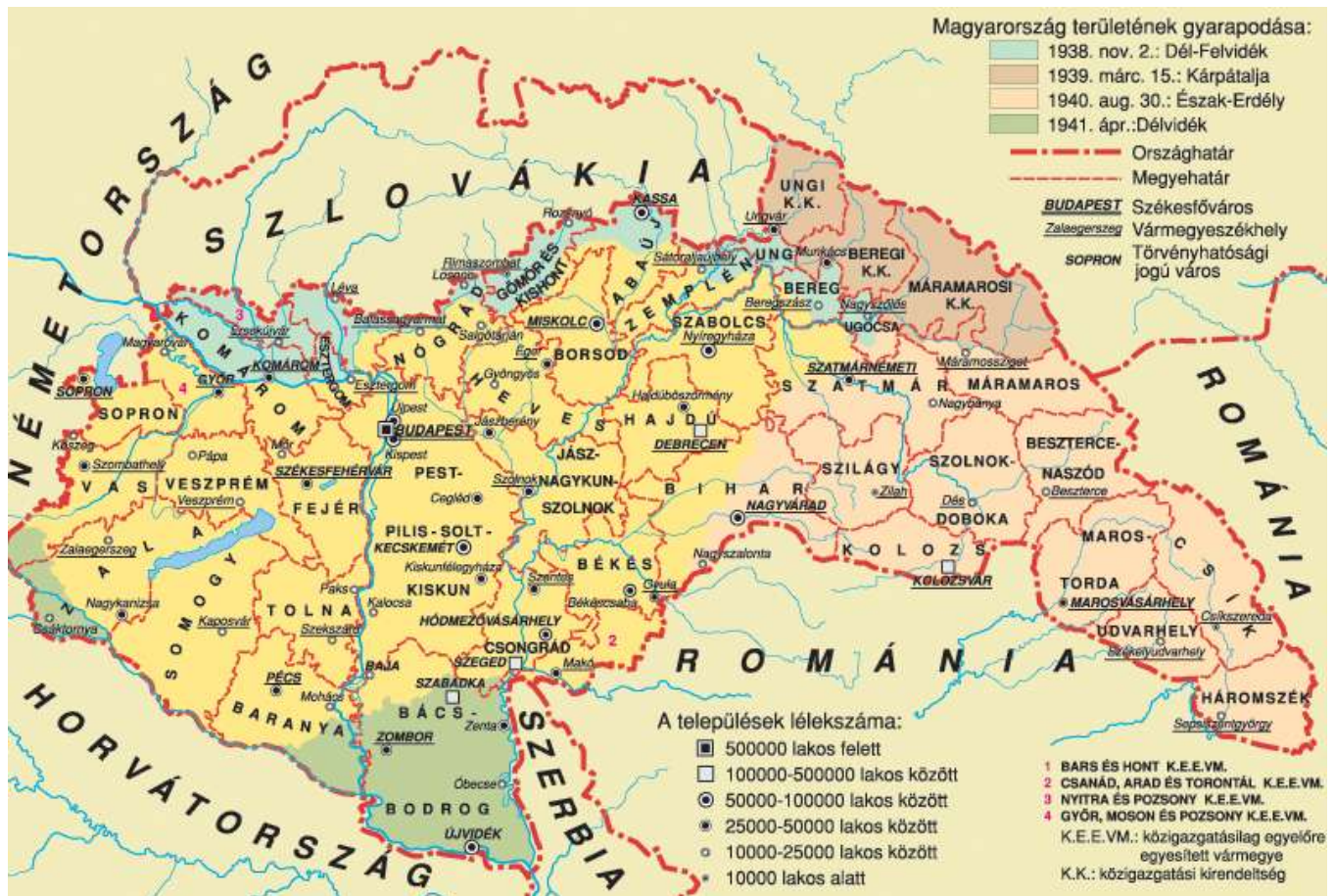
A terület-visszacsatolások térképe