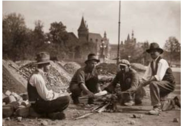
Napszámosok ebéd közben