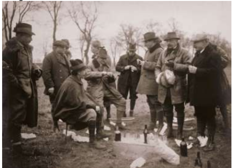
Bethlen István vadászaton