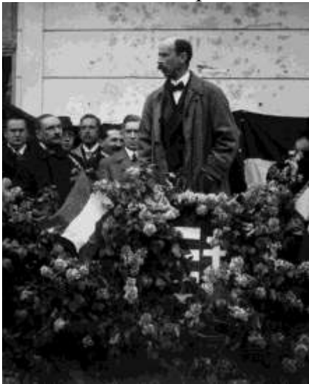
Bethlen István szónokol

b) Bethlen István (1921-31) ⇒ tíz évig megszakítás nélkül miniszterelnök ⇒ róla kapta a nevét a rendteremtés korszaka. Erdélyi arisztokrata származású, konzervatív politikus, jogi tanulmányok után országgyűlési képviselő. A románok előretörésekor elveszíti erdélyi birtokait. 1919 februárjában megalapítja a Nemzeti Egyesülés Pártját, majd márciusban az Antibolsevista Comité-t. Az ellenforradalmi kormány tagja, 1920-ban részt vesz a párizsi béke delegációban is.