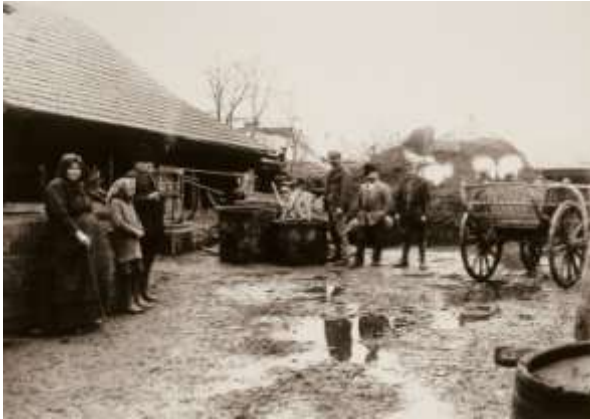
Falusi porta az 1920-as évekből