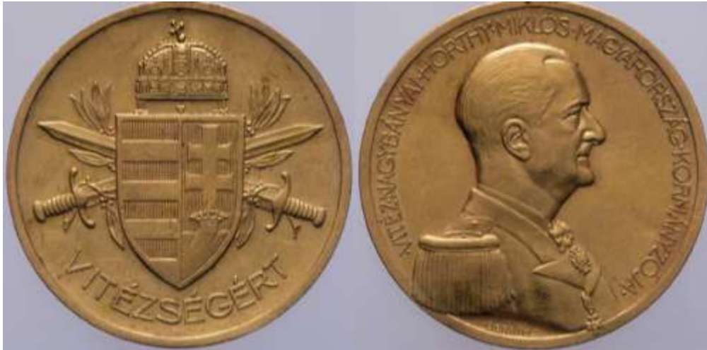
Vitézségi érem Horthy Miklós arcképével