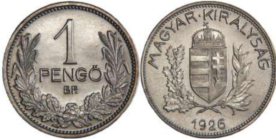
A pengőt 1926-ban vezették be