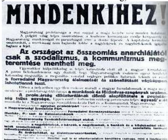
Mindenkihez: kiáltvány a hatalomátvételtől