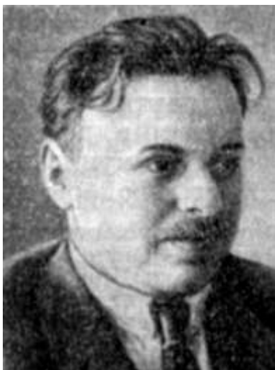
Kun Béla, a fő diktátor