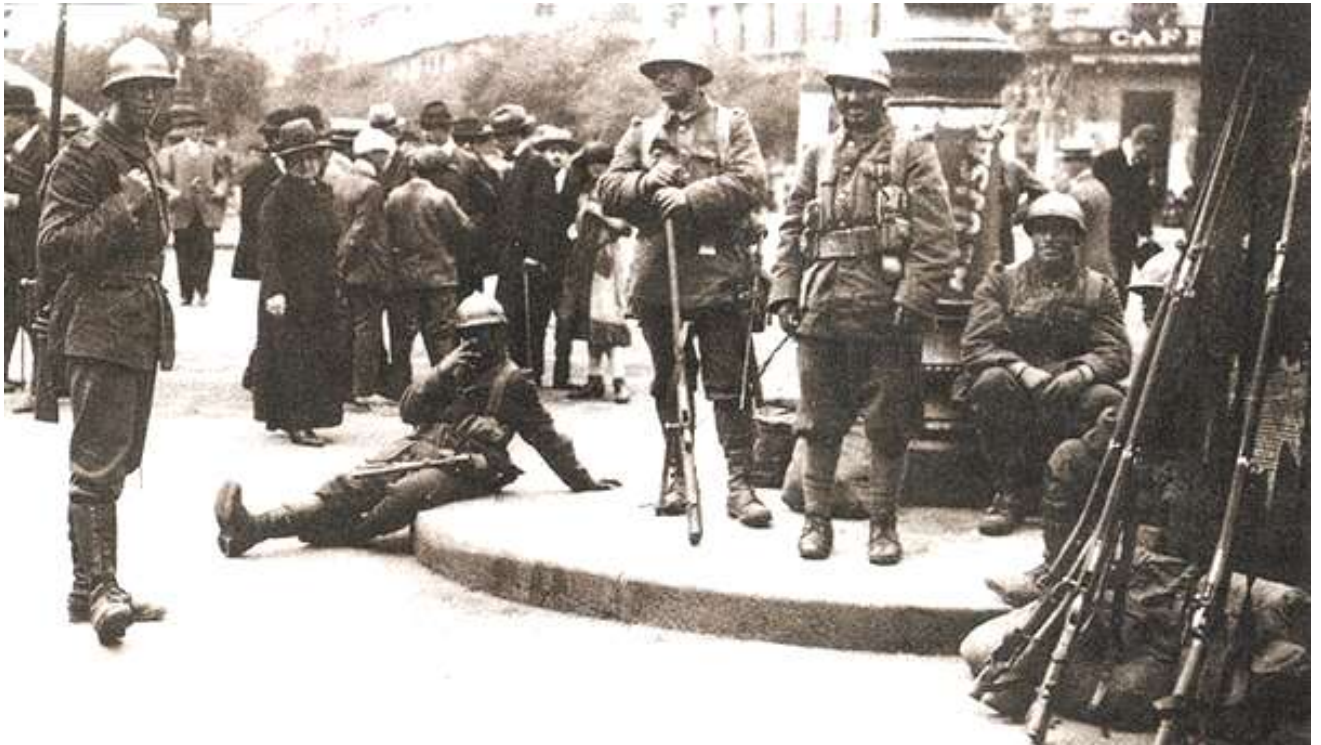
A magyar történelem egyik legsötétebb időszaka: megszálló román katonák pózolása Budapesten