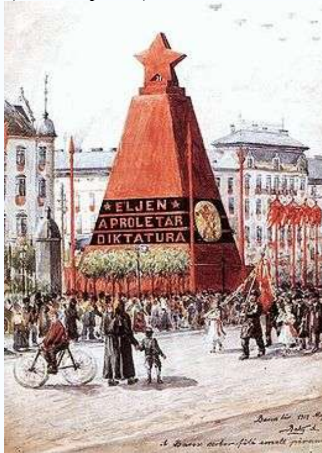
Budapest, 1919. május 1.