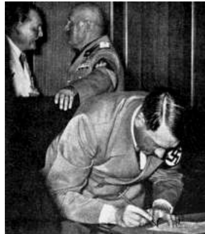
Hitler aláírja a szerződést

Idáig Hitler mindent megtehetett , az antant elnézte neki, mert tudták, hogy katonailag ő a legerősebb Európában