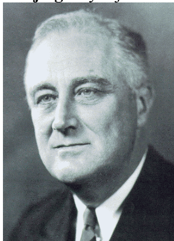
Franklin D. Roosevelt