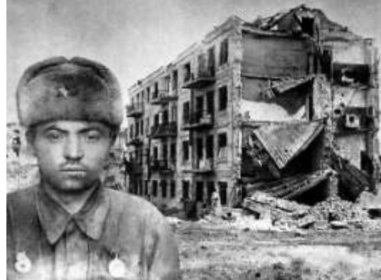
Sztálingrádnál a harcolók szó szerint rommá lőtték szét az egész várost