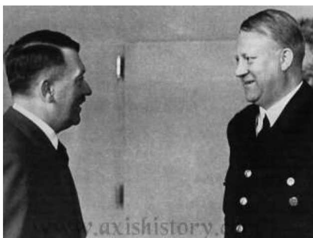
Adolf Hitler és Vidkun Quisling, Norvégia diktátora