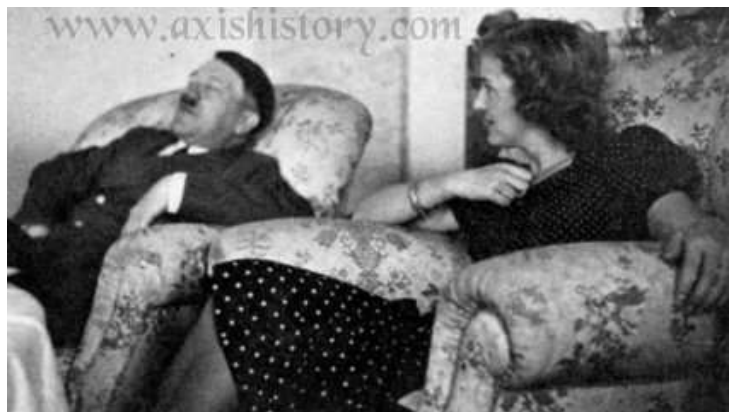
Hitler és Eva Braun együtt lettek öngyilkosok