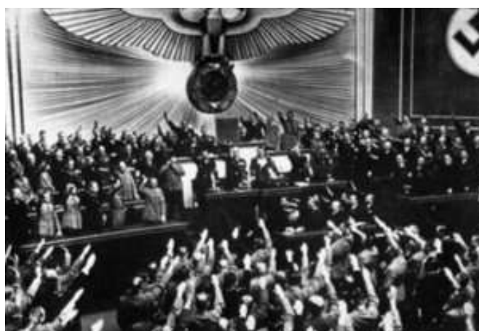
Tömegek éltették az Anschluss, Ausztria és Németország egyesülését (bár a béke ezt is megtiltotta)

b) megvalósítja az Anschluss : Németország és Ausztria egyesül (1938)