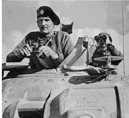
Bernhard Montgomery (Monty)