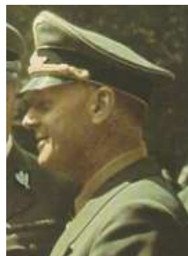
Joachim von Ribbentrop, Hitler külügyminisztere

c) Anglia és Franciaország figyelmezteti Hitlert: ha megtámadja a lengyeleket, hadat fognak neki üzeni