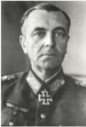
Paulus, a sztálingrádi vesztes

A sztálingrádi harcokat nagyon megszenvedte az ártatlan civil lakosság is