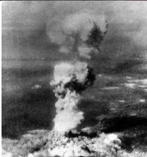
A kisfiú és műve (Hirosima, 1945. augusztus 6.)