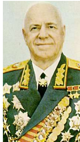
Zsukov marsall, a sztálingrádi győző