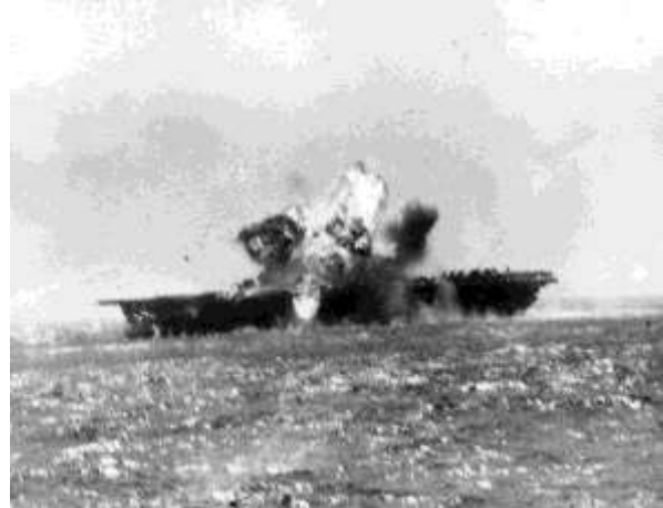
...és kamikaze után