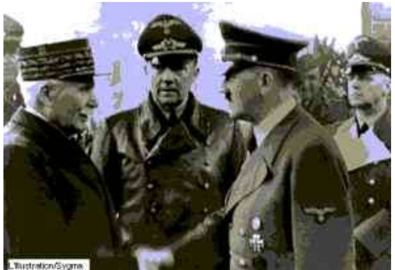
Petain francia kormányzó Hitlerrel