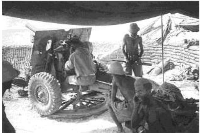
Az el-alameini csata pillanatképei