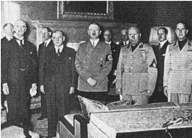
A müncheni szerződés döntőbírái

⇒ Szlovákia önálló lesz, de Hitler-imádó miniszterelnökkel (Tiso) ⇒ azt fogják tenni, amit Hitler kér tőlük