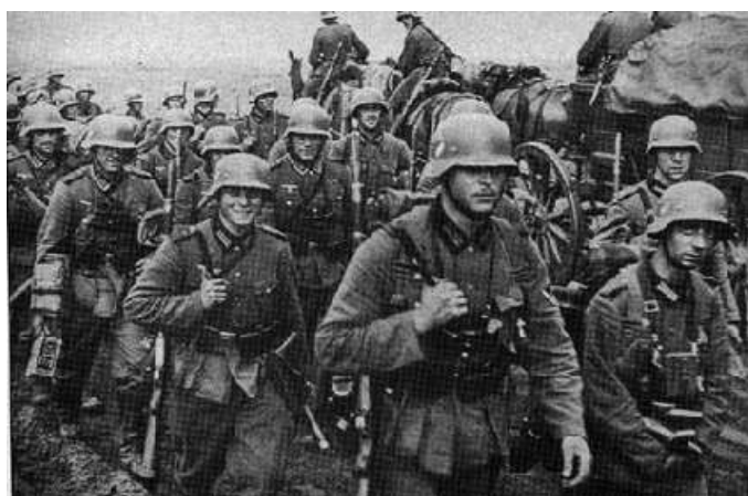
A német hadsereg bevonul a béke szerint fegyvermentes Rajna-övezetbe

a) remilitarizálja (=újrafegyverzi) a Rajna-vidéket (1936)