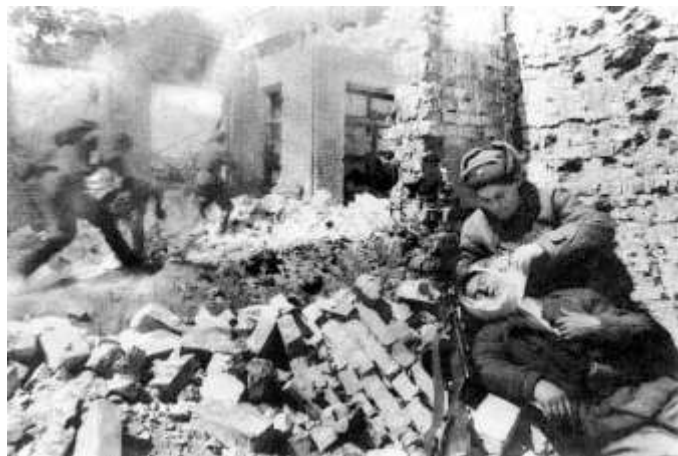
A sztálingrádi csatában minden házért külön meg kellett harcolni