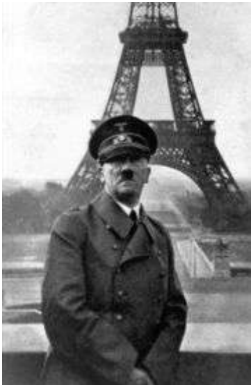
Hitler az Eiffel-toronnyal