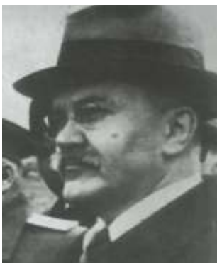
Vjacseszlav Mihajlovics Molotov, Sztálin külügyminisztere

⇒ a két ország felosztja egymás között Lengyelországot