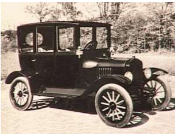
Ford: a legendás T-modell