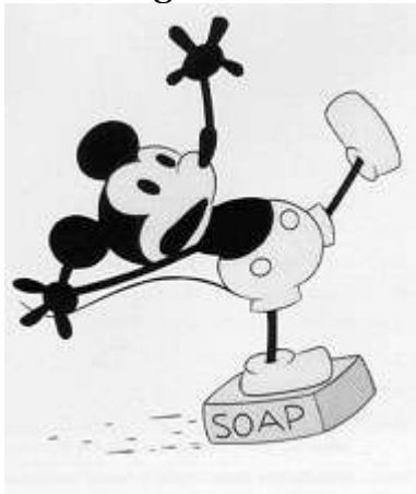
Walt Disney Miki egere