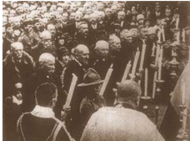
Magyar filmhíradó 1928-ból