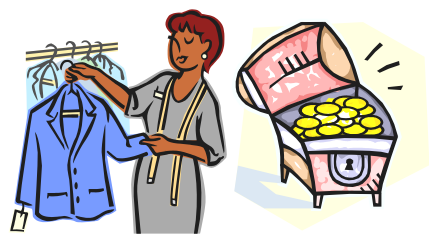
e) Felvevőpiac ⇒ profit (haszon) (az iparcikket el kell adni)