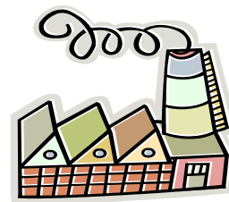
c) Ipari ásványkincsek (vasérc, szén, színesfém)