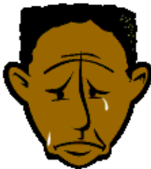
d) Olcsó munkaerő