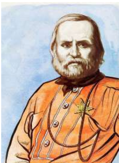
Giuseppe Garibaldi, a vörösingések vezére