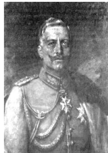
II. Vilmos, Németország császára