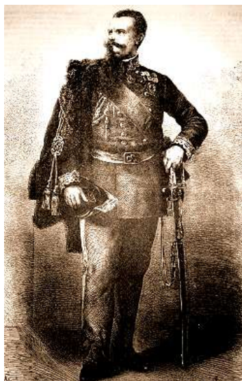
Viktor Emánuel, Olaszország királya