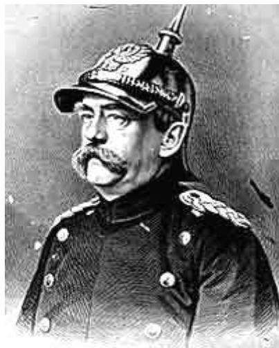
Otto von Bismarck, a vaskancellár