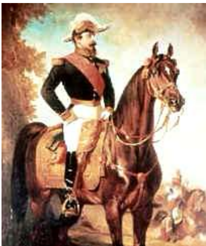
III. Napóleon, francia császár