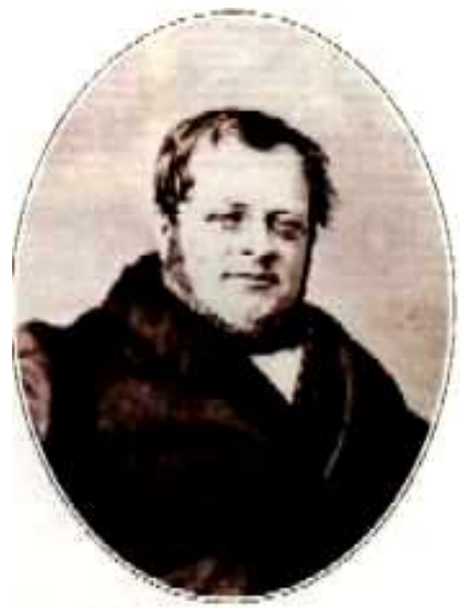
Camillo Cavour, piemonti belügyminiszter