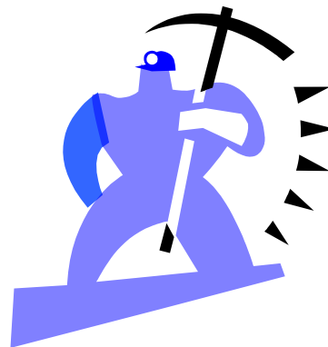
Fegyveres felkelés: ha nem láttak más megoldást, hajlandók voltak harcolni is.

3. Városiasodás: a városi életforma terjedése