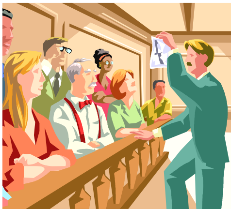
szakszervezeti mozgalom: választott képviselők útján tárgyalnak a gyárosokkal