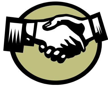
segélyegyletek az öregek, betegek, özvegyek és munkanélküliek részére