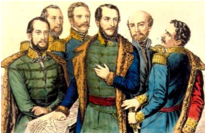
Kossuth Lajos tábornokai között

(Klapka György, Perczel Mór, H. Dembinski, Kossuth, J. Bem és Aulich Lajos)