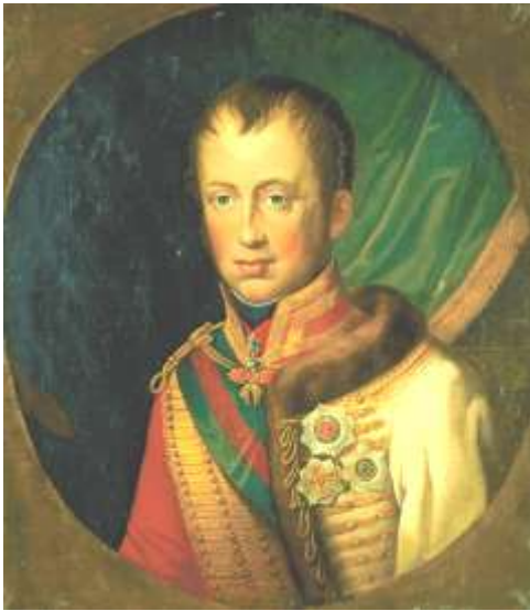
V. Ferdinánd (1835-1848)