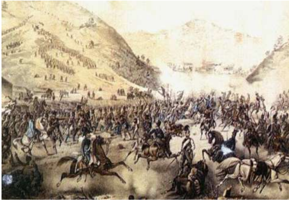
A pákozdi győzelem