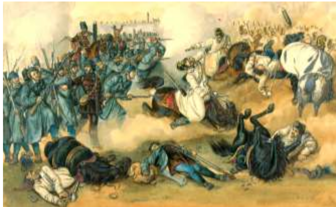
A komáromi csata (Than Mór festménye)