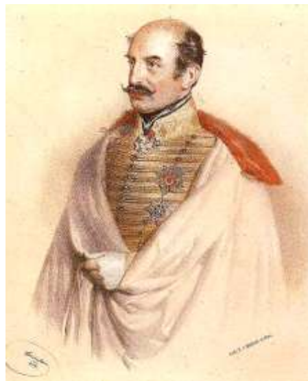
Jellasics horvát bán