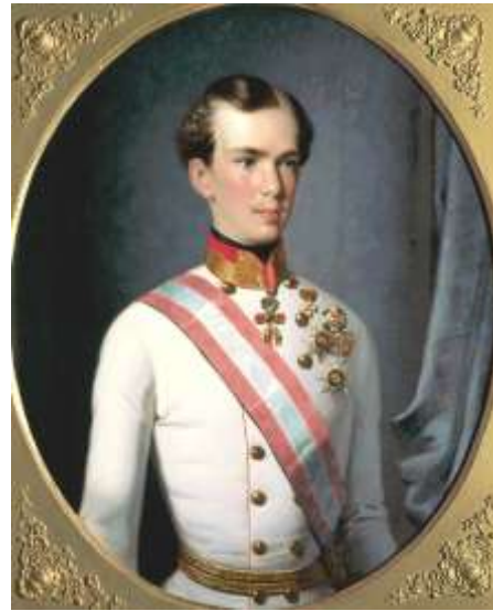
I. Ferenc József (1848-1916)