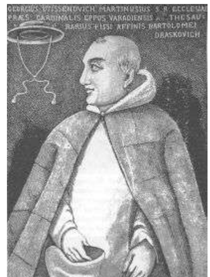
Fráter (Martinuzzi) György pálos szerzetes