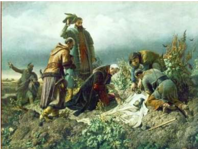
II. Lajos holttestének megtalálása