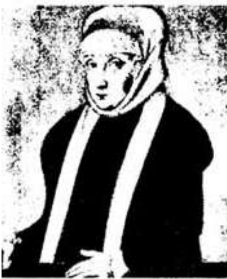
Jagelló Izabella királynő, Szapolyai János felesége