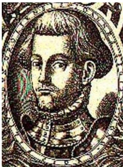
János Zsigmond, Erdély első fejedelme