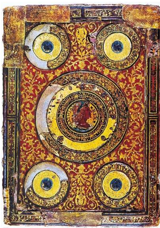
16. kép: Corvina kötéstábla egy imakönyv borítóján

A bőrkötések harmadik és legnagyobb csoportját a keleti és olasz motívumokat egyesítő sajátos stílus jellemzi, mely minden más könyvkötési stílustól elüt, és csupán Mátyás kézíratain fordul elő. Ez a tulajdonképpeni jellemző és tipikus Corvin-kötés. Valamennyit a díszítőelemek azonossága és a dús aranyozás jellemzi, amit Európában legelőbb éppen ezeken a kötésekben alkalmaztak ilyen nagy mértékben.