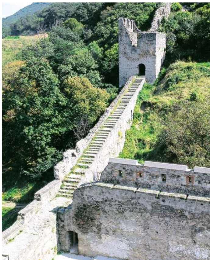
6. kép: A visegrádi alsóvár falának maradványa

Az udvar belső oldalán, a hegy lábánál, mely kissé magasabban fekszik, áll egy pompás kápolna, mozaikberakás borítja, miként a nagyrészt a többi szobát is, van benne egy drága zeneszerszám, melyet a köznyelv orgonának nevez, néhány ezüstsíp díszíti, ezenkívül az Úr testének szentségtartója és három oltárt, domborművekkel és képekkel, melyeket a legtisztább aranyozott alabástromból készítettek. Innen kelet felé ágba nyúlnak a király remekbe készült, aranymennyezetes termei. Az egyik úton a hosszú palotába lehet jutni, efelett a hegy magasodik, a másikon lehet menni tovább a lentebb fekvő szobákhoz. A kis udvar közepén itt is forráskút emelkedik alabástromból, fedett márvány oszlopcsarnok köríti, ez védelmet nyújt a lángoló nyári napsütés ellen. Ezután a szobák észak felé fordulnak, végül nyugat felé térnek vissza. Ablakuk mindenünnen a széles mederben folyó Dunára nyílik, s ez a kitekintőnek nagy szépséget mutat, különösen, hogy a Duna túlsó partján elterülő vidéken látható q német telepések által lakott Nagymaros mező város is felette messzire nyúló, nem túl magas hegy emelkedik s szőlőkkel végig bevan ültetve. Ezt a királyi palotát pompás fekvése mellett olyan drága épületek díszítik, hogy vitathatatlanul úgy tűnhet, sok királyság épületeit felülmúlja. 33