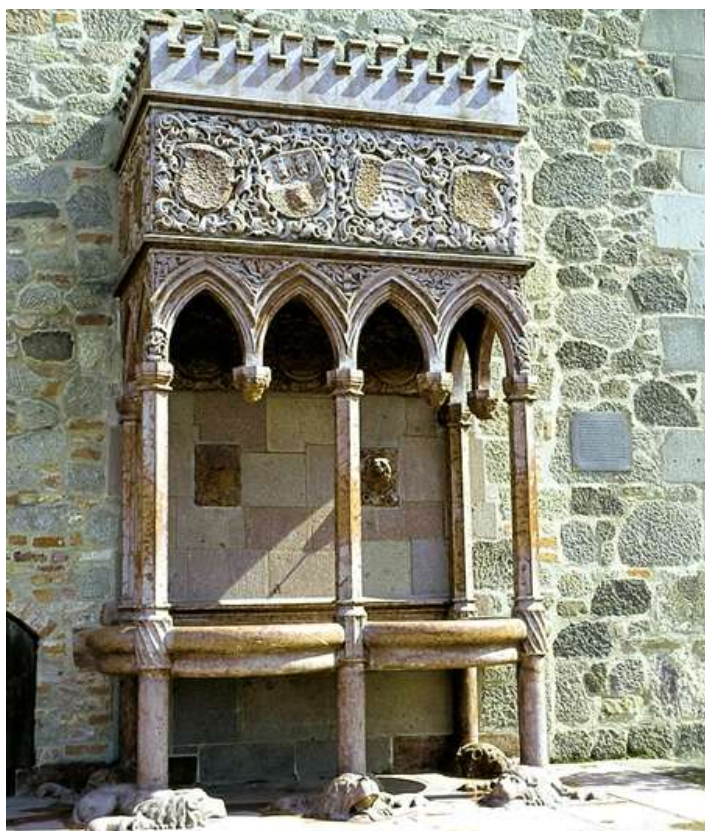
11. kép: Mátyás király oroszlános szökőkútja Visegrádon

A budai királyi palota a nagyszabású bronzszobrokon kívül – ismét a reneszánsz szokásainak megfelelően – bőségesen el volt látva szökőkutakkal, vízmedencékkel. A kert fehér márványból és ezüstből készült kettős kútját, úgyszintén a kőből faragott nyolcszögletű gótikus kutat Mátyás és Beatrix címerével az ásatások hozták napfényre a palotától délkeletre a jelenlegi kertben, a várfalak sarkában. Az előudvarban – vagy a Friss-palota udvarán – hatsöves nagy szökőkút állott, melyből nagy ünnepélyek alkalmával bor csörgedezett. A belső udvarban kisebb, valószínűleg falikútszerű vízmedence volt elhelyezve. Ugyanitt az oszlopos árkádok előtt, a kápolna bejáratával szemben emelkedett a díszes Pallas-kút, vagy magyarosan a „csatornakút”. Csaknem teljesen épen maradt fenn egy vörösmárvány falikút, melyet egyszerű, sima reneszánsz keret és két erőteljesen mintázott oroslánfej díszít. Végül tudunk még egy fehér márvány szökőkútról, melyet nem kisebb mester, mint Verrocchio faragott Firenzében a magyar királynak, és Poliziano írt róla magasztaló epigrammákat. 55