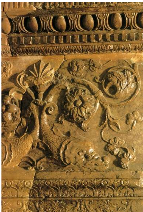
10. kép: Delfines fríz márványtöredék a budai palotából

hetvenes években – egyre nagyobb szerephez jutott a reneszánsz dekoratív szobrászat. Az oszlopfőkön, frízeken, pilasztereken bőséges alkalom nyílt ornamentális vagy figurális díszre.