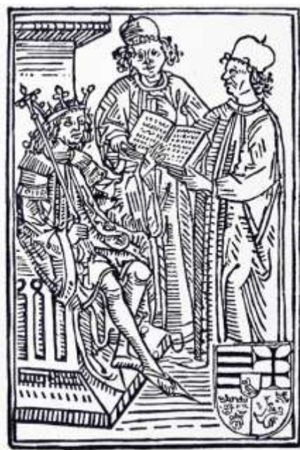
2. kép: Mátyás törvénykönyvének címlapja

királyi bevétel alól ugyanis rengetegen szereztek mentességet, ami által kivonták magukat az adózás alól. A reformmal Mátyás ezeket a jövedelmeket új névvel léptette életbe, ami alól senkinek sem volt mentessége. Így a királyi kincstár adója és a koronavám az eddigi jövedelmeket megsokszorozta. (Erdélyben emiatt összeesküvést is szerveztek Mátyás ellen, amit ő kemény kézzel fölszámolt.) A reformhoz tartozott az is, hogy a jövedelmek központi kezelője a kincstartó lett, aki nem előkelő személyiség volt, hanem egy udvari hivatal vezetője. Maga is szakember volt, és a hivatalban is nagyrészt köznemesi származású szakképzett emberek dolgoztak. Mivel fizetett alkalmazottak voltak, a király akaratának mindenben engedelmeskedtek. A jövedelmek súlypontja azonban uralma alatt áthelyeződött a rendkívüli hadiadóra. Először a korona visszaszerzésének fedezésére rendelte el az országgyűlés beleegyezésével a telkenként 1 aranyforintnyi rendkívüli adót. Később ezt honvédelmi célokra szedette be, majd ötévenként előre megszavaztatta, sőt időnként az országgyűlés megkérdezése nélkül is beszedte. Pénzjövedelmei így rendkívüli módon megnövekedtek, ez tette lehetővé, hogy állandó fizetett zsoldoshadsereget tudott tartani, és hogy a hivatalnokok szintén fizetett alkalmazottakká váltak.