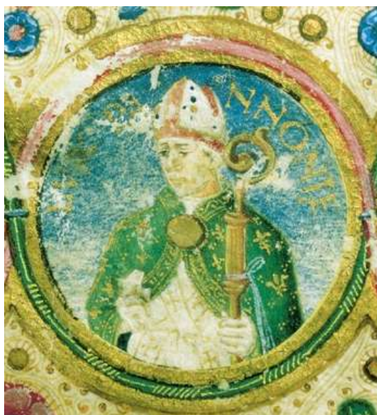
3. kép: Vitéz János képe a Tribachus-kódexből

A 15. századi Itáliában fénykorát élte a reneszánsz művészet, az Alpoktól északra fekvő országokban azonban jószerével még csak hírből ismerték. Az új stílus elsők között Mátyás király Magyarországon kezdte meg hódító útját az 1470-es években. Szálláscsinálói az új típusú műveltségeszményt írásaikkal képviselő humanisták voltak, akik a világi és egyházi fejedelmek szolgálatába állva a XV. században Európa minden valamirevaló udvarában megjelentek. Hazánkban a XV. század annak ellenére, hogy a politikai életben számottevő nehézség mutatkozott, a gazdaságban és a társadalom életében igen nagy fellendülést jelentetett. Magyarország az Anjouk által kijelölt úton haladt az európai polgárosodás modelljét követte mind Zsigmond, mind a Hunyadiak alatt.