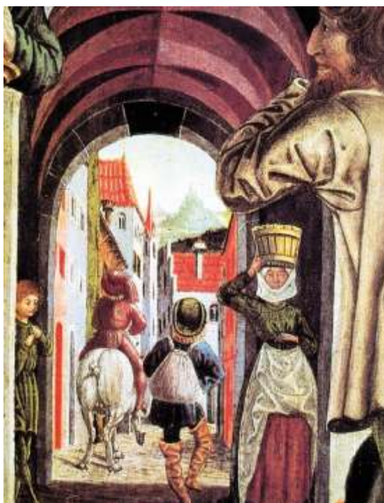
12. kép: Középkori utcarészlet táblakép töredéken (1470 körül)

Mátyás uralkodása alatt a festőcéhek országszerte virágzottak, szervezetük már kiformalódott, sőt a festők mesterremekére nézve is határozott szabály alakult ki. Seybold 1476-ban Budán is találkozott egy festővel, nyilván a helybeli céh valamelyik tagjával, és egy festőinással, de nevüket nem jegyezte meg. A szerzetesek is buzgón művelték a festészetet. Mátyás mind a céhbelieknek, mind pedig kedvelt pálosainak adhatott megbízást vallásos képekre. A budai várkapolnát – Bonfini szerint – számos képpel ajándékozta meg. Közülük nem hiányozhatott Alamizsnás Szent János képe sem, akinek az ereklyéjét Mátyás nagy ünnepélyességgel helyezte el éppen a várkapolnában. A festmények egy része hazai mester munkája lehetett. A török elől Pozsonyba menekített királyi kincsek között is volt egynéhány értékes kép, hordozható oltár, aranyozott ezüst foglalatban. Közülük egyik vagy másik még Mátyás kincseiből származhatott.