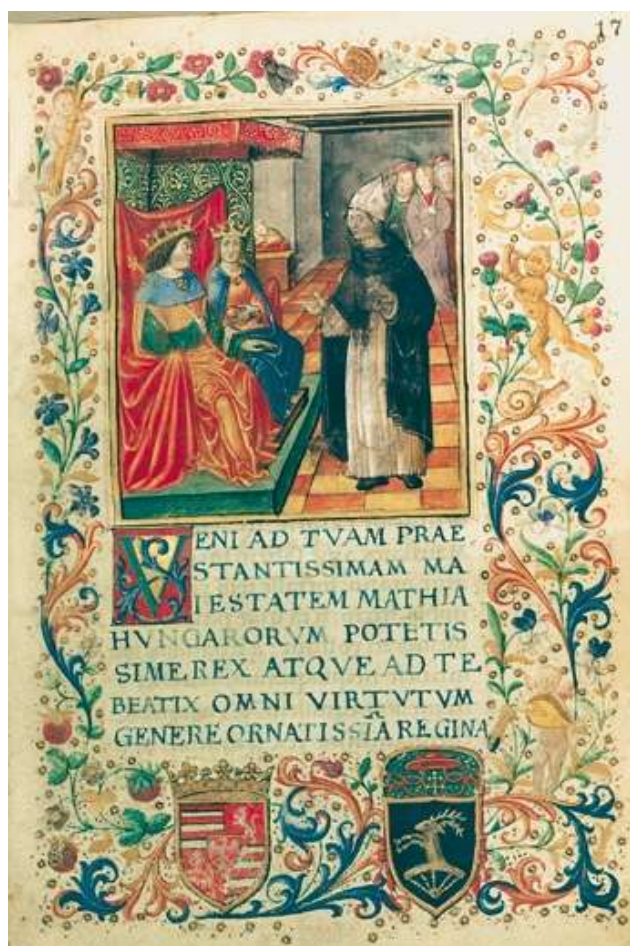
4. kép: Mátyás és Beatrix

ágyazva tárgyalta, és sok ókori forrásból merített. A magyar múltból szóló ismeretek a XIX. századig főképp Bonfini művéből származtak, itthon és külföldön egyaránt. Népszerűségben Bonfiniéval vetélkedett Galeotto Marzio Mátyásról szóló könyvecskéje, amelyben a szerző anekdotaszerű kis történetekben örökítette meg élményeit a királyról és családjáról, a magyar szokásokról és műveltségéről, magyar barátairól. Az utóbbiak közül Bátori Miklósról emlékezik meg a legmelegebben. 24