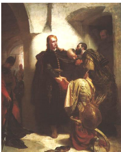
Benczúr Gyula: Hunyadi László búcsúja