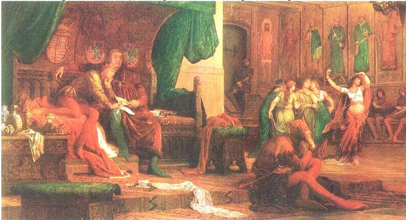
Székely Bertalan: V. László és Cillei Ulrik