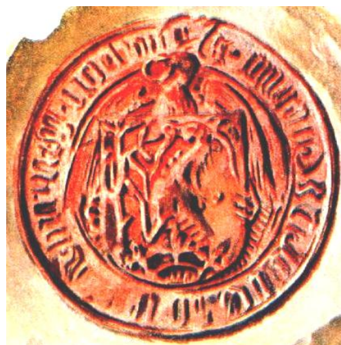
Szilágyi Mihály pecsétje